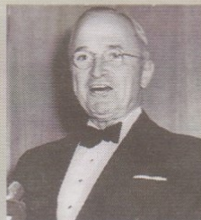
◀ Truman durante su primera presidencia.

El 12 de marzo de 1947, el presidente demócrata Harry Truman se dirigió a las dos cámaras del Congreso estadounidense. Leyendo de un cuaderno que tenía delante, dijo gravemente uno de los discursos más decisivos de sus dos presidencias: